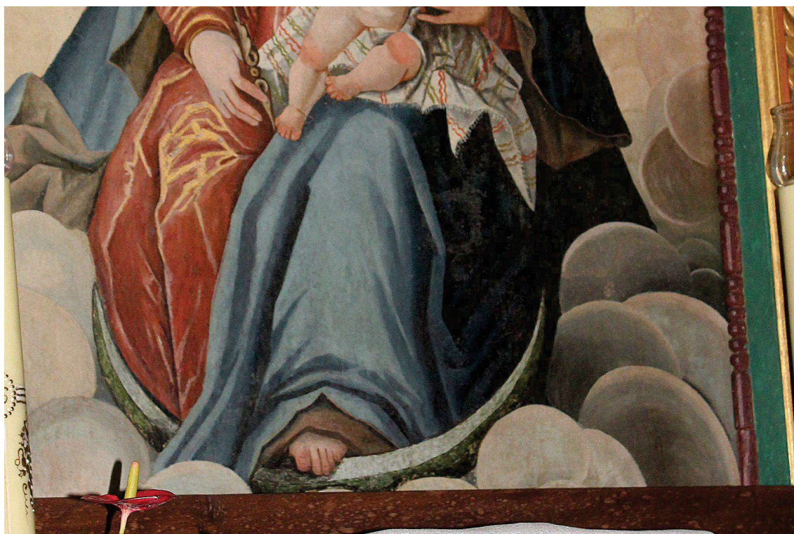
Fot. 13. Ołtarz główny z Kościoła p.w. Św. Jana Chrzciciela w Białej Szlacheckiej. Obraz Matka Boska z Dzieciątkiem. Fragment. Przed konserwacją. Fot. M. Kwiatkowski 2017 r.