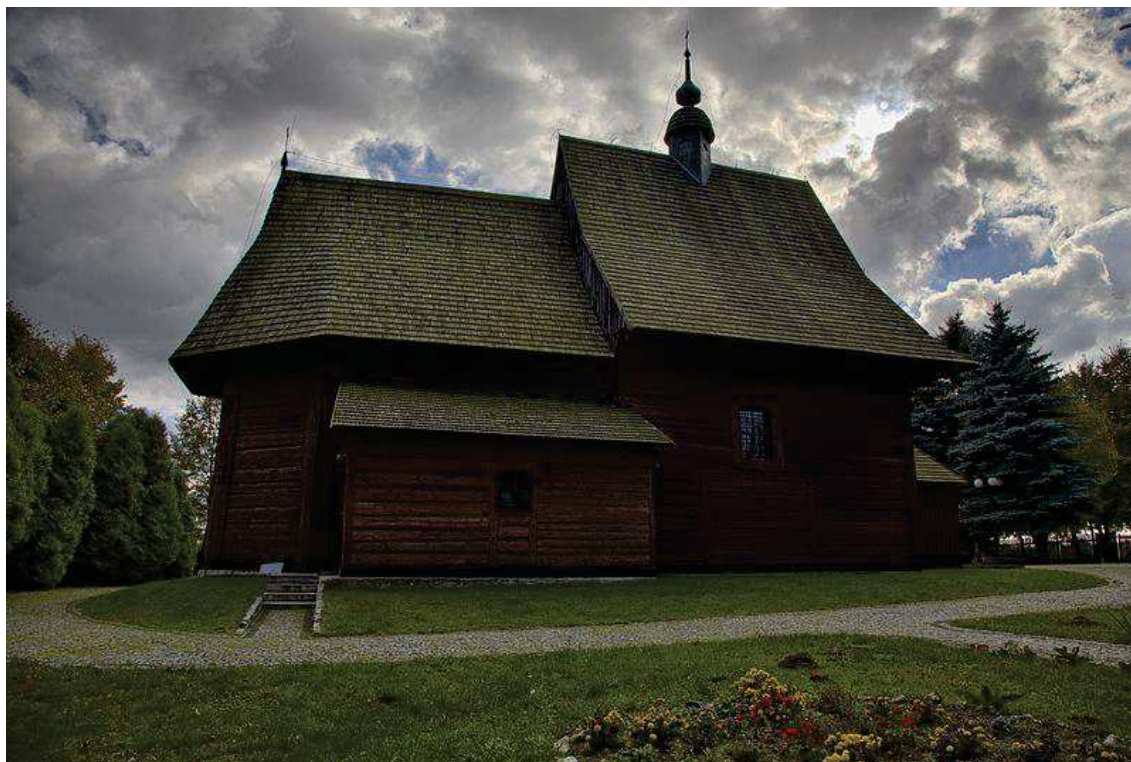
Fot. 1. Kościół p.w. Św. Jana Chrzciciela w Białej Szlacheckiej. Fot. M. Kwiatkowski 2017 r.