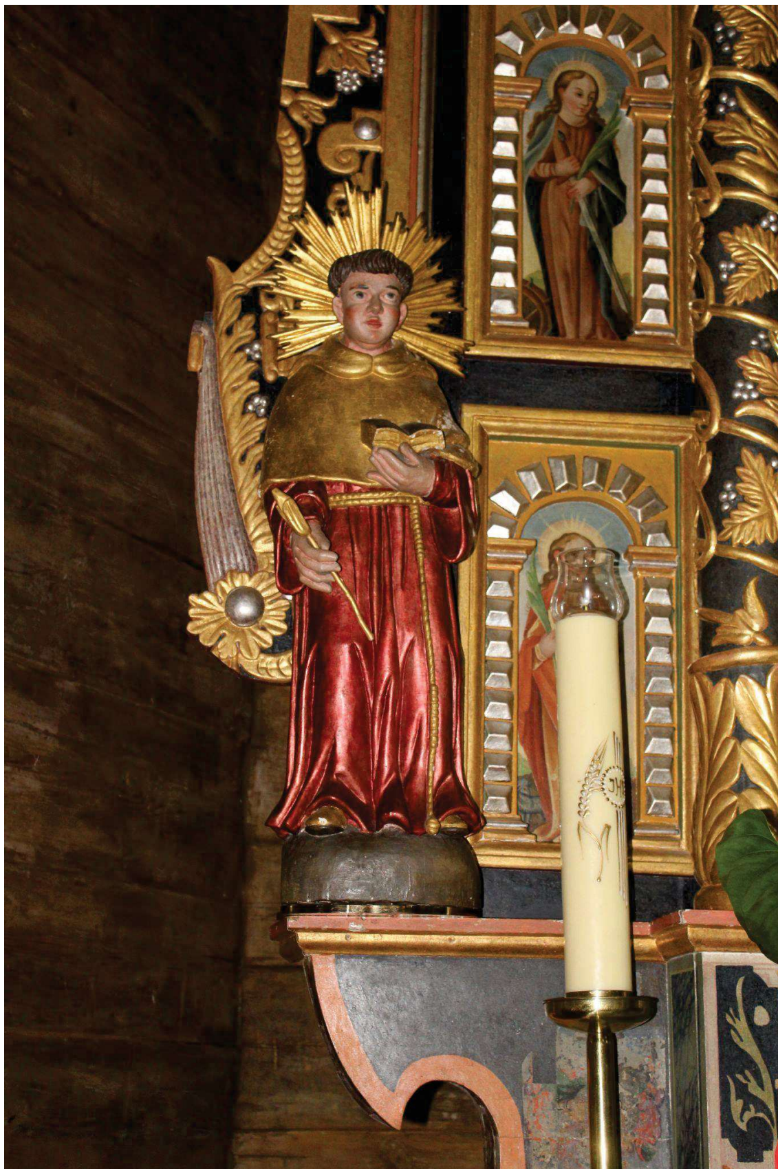
Fot. 4. Rzeźba z ołtarza głównego z Kościoła p.w. Św. Jana Chrzciciela w Białej Szlacheckiej. Przed konserwacją.