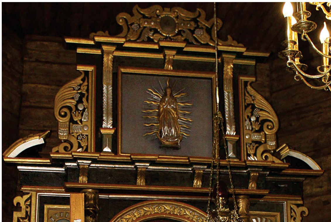
Fot. 12. Zwieńczenie z ołtarza głównego z Kościoła p.w. Św. Jana Chrzciciela w Białej Szlacheckiej. Przed konserwacją. Widoczne ubytki warstwy malarskiej, zaprawy i złocień.