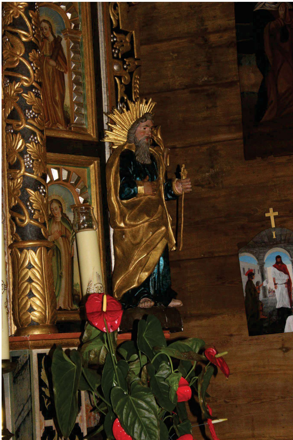
Fot. 5. Rzeźba z ołtarza głównego z Kościoła p.w. Św. Jana Chrzciciela w Białej Szlacheckiej. Przed konserwacją. Widoczne ubytki warstwy malarskiej, złocień.