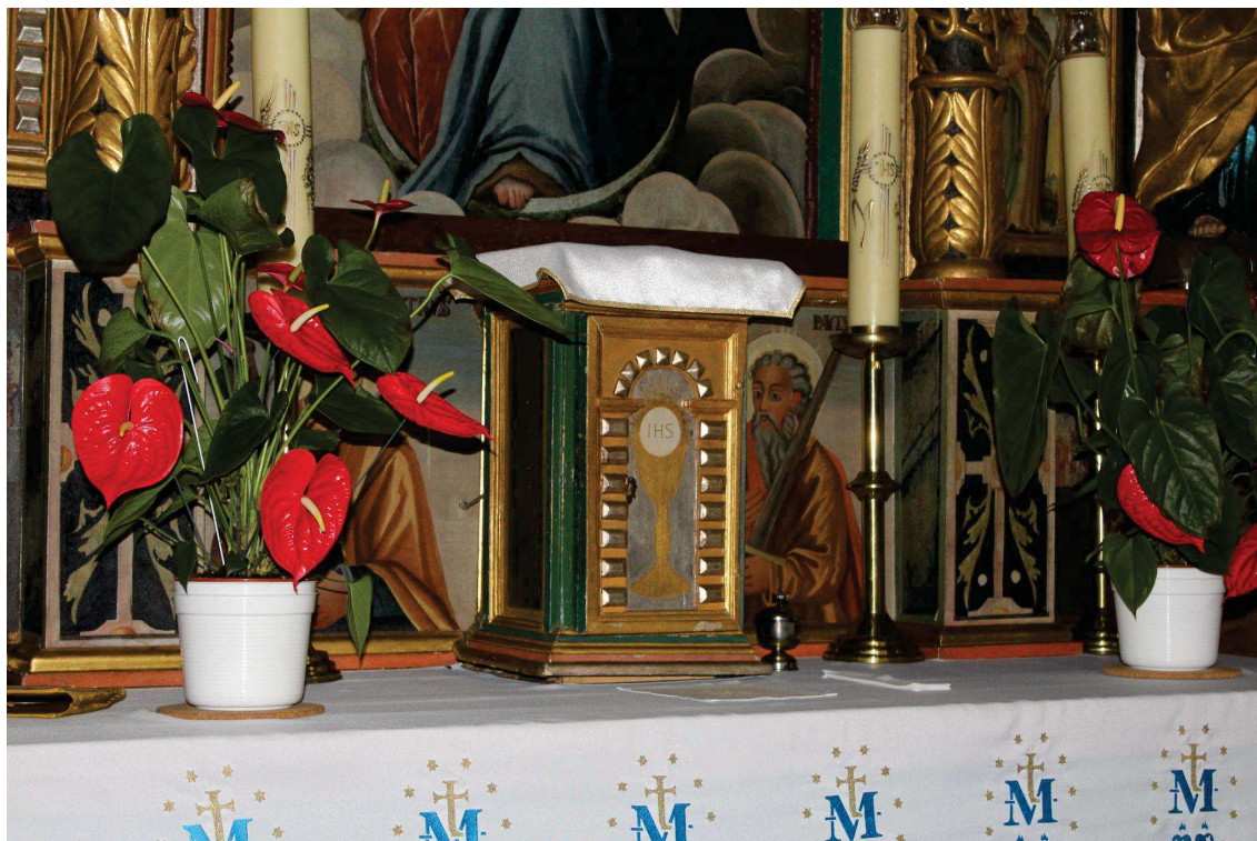
Fot. 6. Tabernakulum z ołtarza głównego z Kościoła p.w. Św. Jana Chrzciciela w Białej Szlacheckiej. Przed konserwacją.