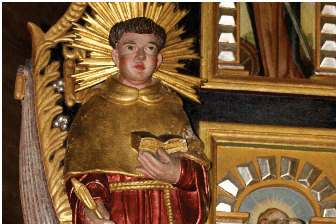
Fot. 8. Rzeźba z ołtarza głównego z Kościoła p.w. Św. Jana Chrzciciela w Białej Szlacheckiej. Przed konserwacją. Widoczne ubytki warstwy zaprawy i złocień. Fot. M. Kwiatkowski 2017 r.