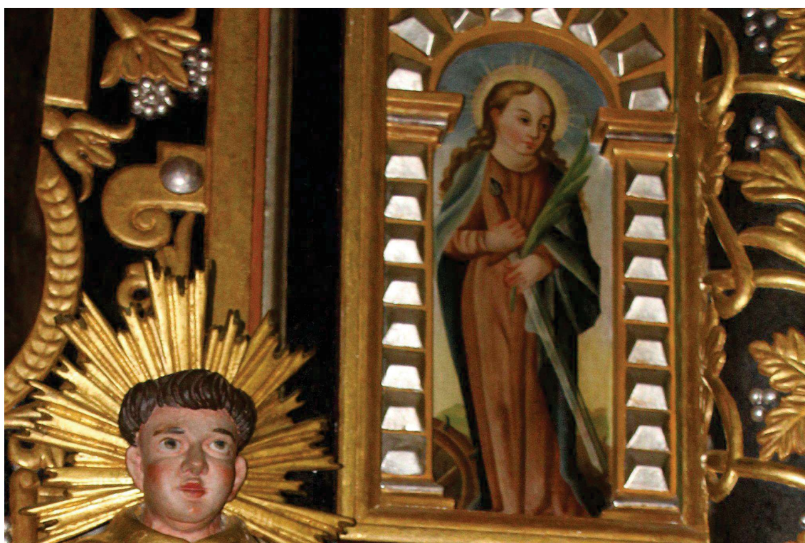
Fot. 7. Obraz tablicowy z ołtarza głównego z Kościoła p.w. Św. J. Chrzciciela w Białej Szlacheckiej. Obraz. Przed konserwacją. Fot. M. Kwiatkowski 2017 r.