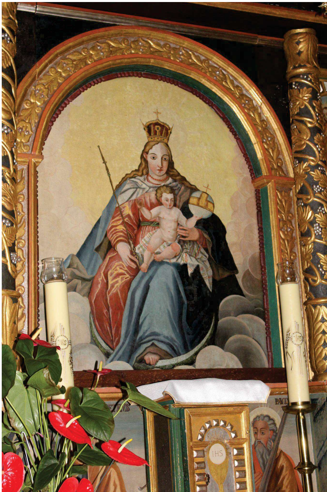
Fot. 3. Ołtarz główny z Kościoła p.w. Św. Jana Chrzciciela w Białej Szlacheckiej. Obraz Matka Boska z Dzieciątkiem. Przed konserwacją.