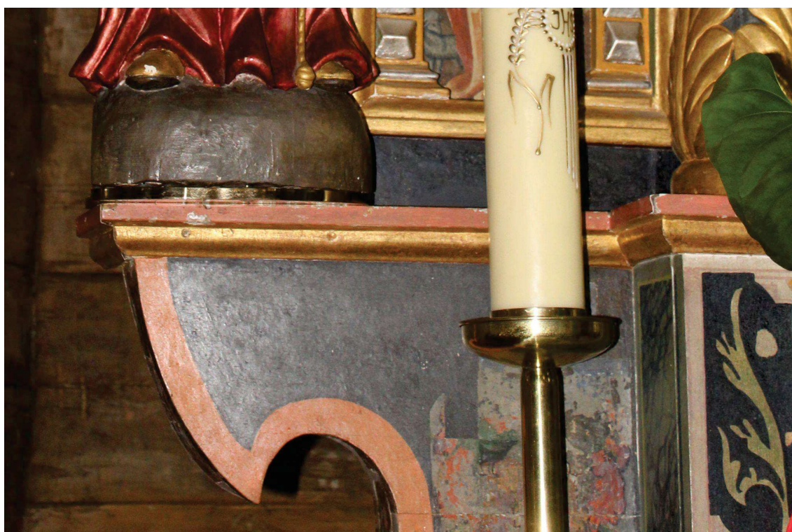
Fot. 9. Predella z ołtarza głównego z Kościoła p.w. Św. J. Chrzciciela w Białej Szlacheckiej. Przed konserwacją. Widoczne pęknięcia, świadek warstwy malarskiej. Fot. M. Kwiatkowski 2017 r.