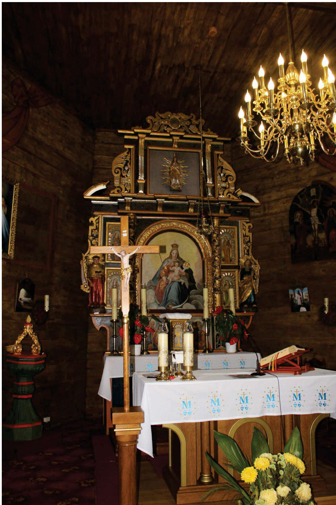
Fot. 2. Ołtarz główny z Kościoła p.w. Św. Jana Chrzciciela w Białej Szlacheckiej. Przed konserwacją. Fot. M. Kwiatkowski 2017 r.