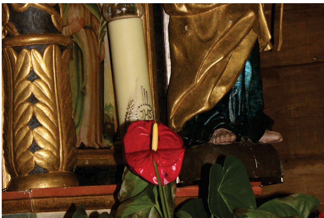
Fot. 11. Rzeźba z ołtarza głównego z Kościoła p.w. Św. J. Chrzciciela w Białej Szlacheckiej. Przed konserwacją. Widoczne pęknięcia, zoksydowane srebro, ubytki zaprawy i złocień. Fot. M. Kwiatkowski 2017 r.