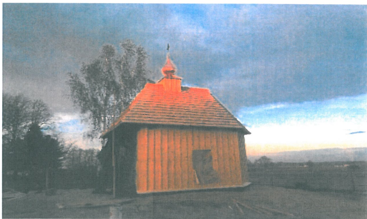
Zdjęcie wykonane w 2017 roku - po przeniesieniu kaplicy

Wykonano nowe fundamenty pod kaplicę w miejscu jej przeniesienia na działce będącej własnością parafii, rozebrano zabytkową kaplicę – znajdującą się na działce prywatnej, uporządkowano teren po rozbiórce, odbudowano ściany kaplicy, odbudowano dach nad kaplicą oraz pełne zewnętrzne deskowanie kaplicy.