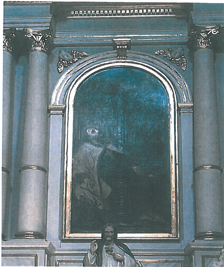
Zdjęcie wykonane przed wykonaniem prac konserwatorskich