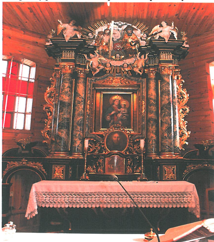
Zdjęcie wykonane przed przeprowadzeniem prac konserwatorskich