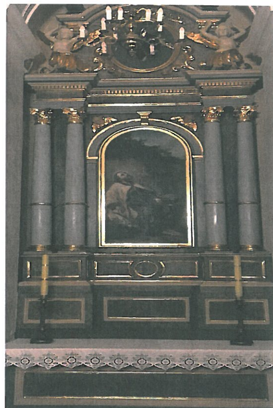
Zdjęcia wykonane po zakończeniu prac konserwatorskich