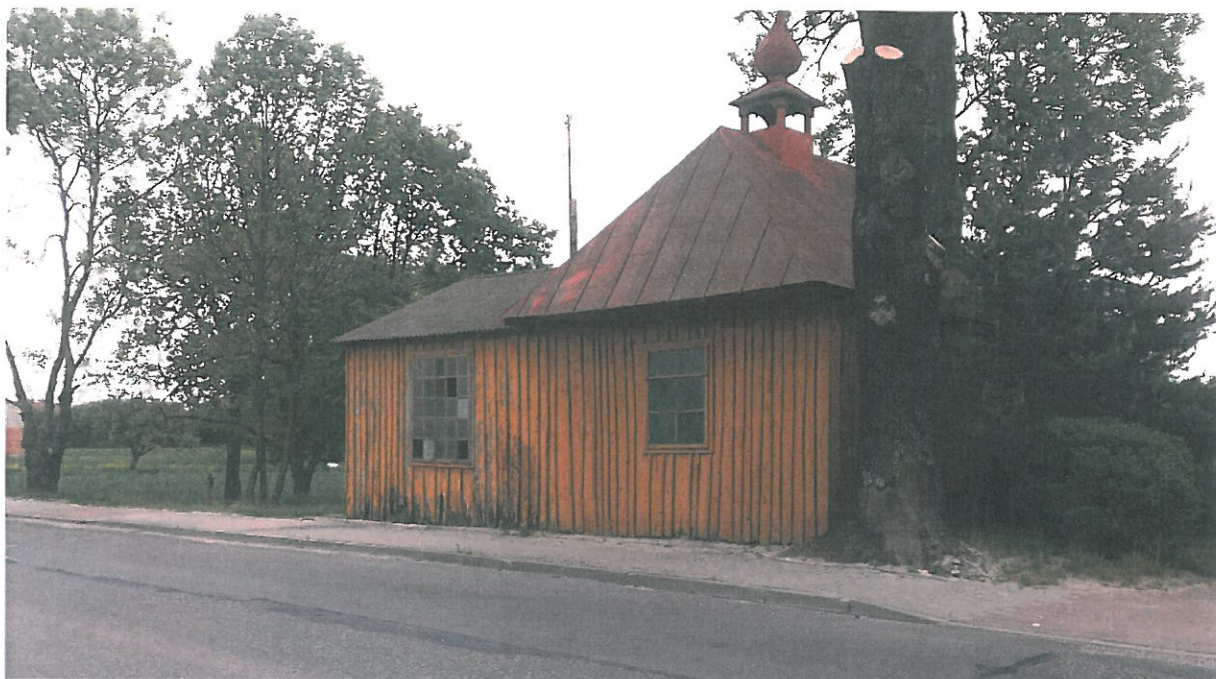
Zdjęcie wykonane przed przeniesieniem kaplicy