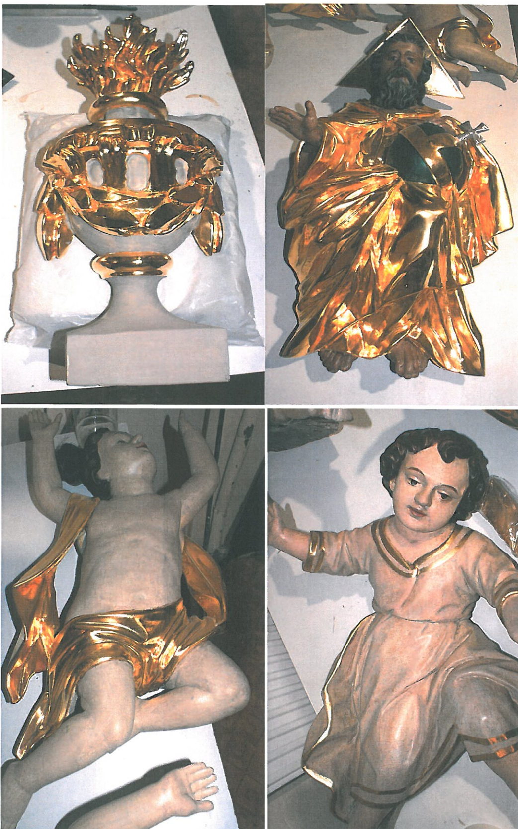
Zdjęcia wykonane po przeprowadzeniu prac konserwatorskich elementów snycerskich złoconych i srebrzonych figuralnych