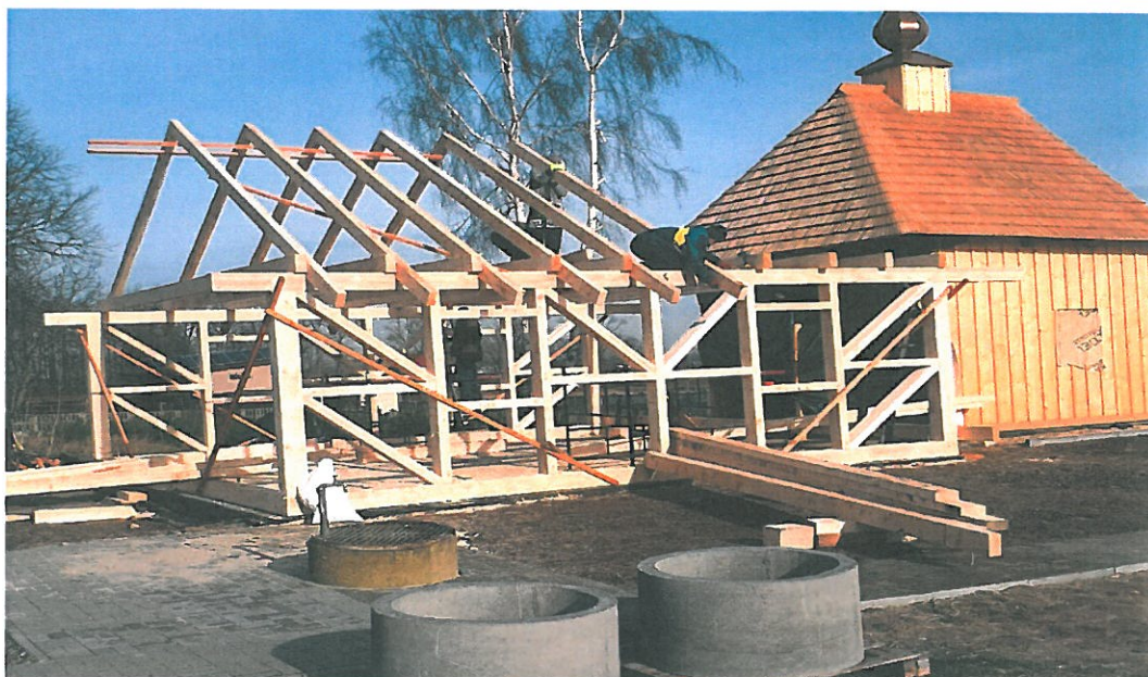
Zdjęcie wykonane w 2018 roku w trakcie trwających prac rozbudowy kaplicy