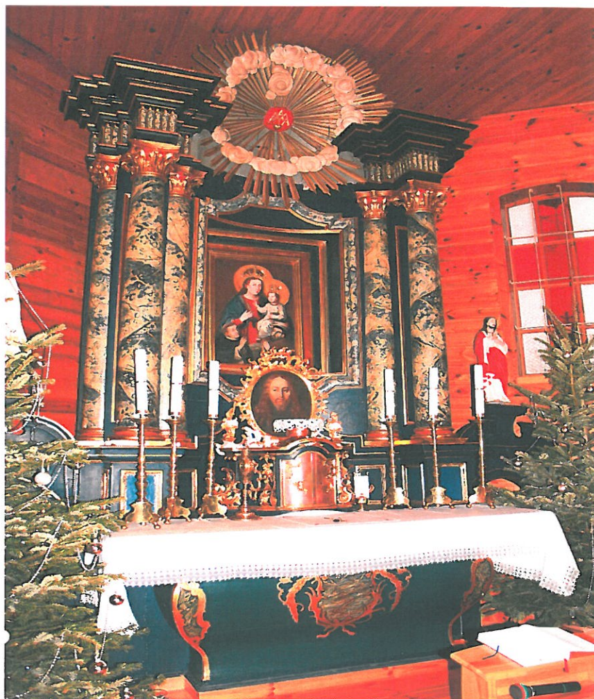
Zdjęcie wykonane po przeprowadzeniu prac konserwatorskich

Prace konserwatorskie barokowego ołtarza głównego p.w. Matki Boskiej w kościele parafialnym w Stróży podzielono na 2 etapy. Pierwszy etap prac, który przeprowadzono w 2017 roku polegał na: